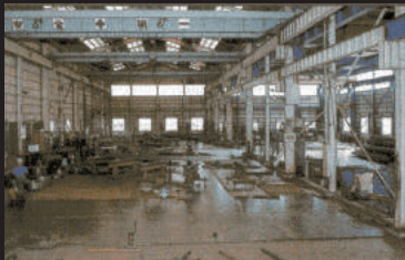
本社ベンダー工場