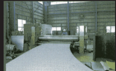
ベンディングロール (320t×3m)