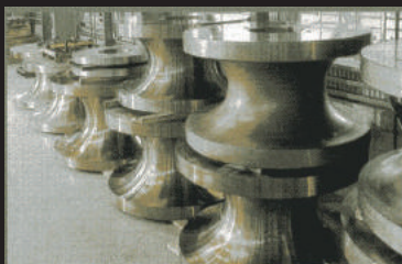
ベンダー用金型 (パイプ)