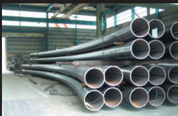
曲げ大型パイプ (羽田空港 2 期工事例)